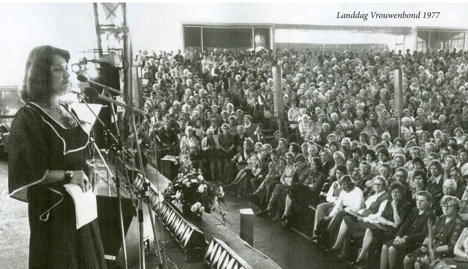
Landdag Vrouwenbond 1977